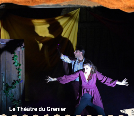
Le Théâtre du Grenier