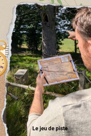
Le jeu de piste

À la fin de leur périple, et s'ils ont réussi à construire leur histoire, les participants se verront remettre leurs diplômes de Raconteurs d'Histoires.