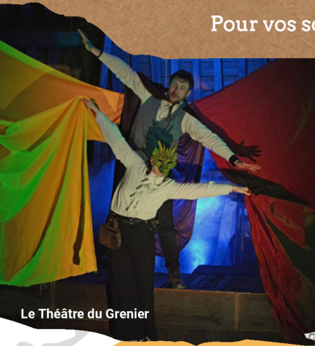
Le Théâtre du Grenier

Pour vos sorties loisirs, choisissez un site original et unique dans le Morbihan !