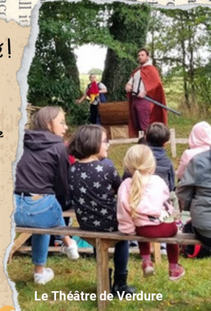
Le Théâtre de Verdure