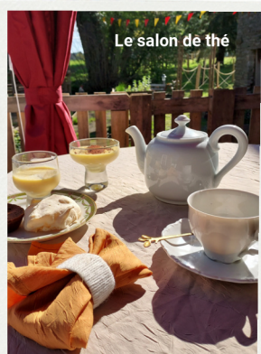
Le salon de thé

1 assiette de desserts faits maison et 1 boisson au choix 6€ par participant.