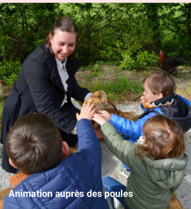
Animation auprès des poules

Le tarif par personne comprend l'entrée au parc, un ou deux spectacles selon la formule choisie, le jeu de piste et une animation auprès des animaux.